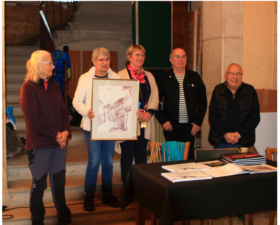
«La gagnante du prix du public et l'équipe organisatrice »

À l'issue de la remise du prix, les organisateurs ont annoncé l'organisation en 2026 de deux salons des Arts en Fête, un au printemps, réservé aux photographes, et l'autre à l'automne pour les peintres.